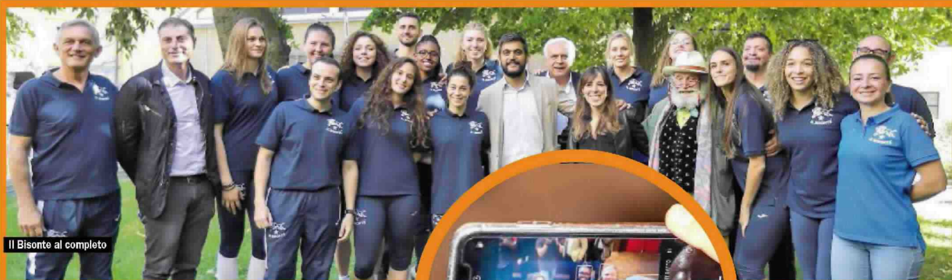
Il Bisonte al completo