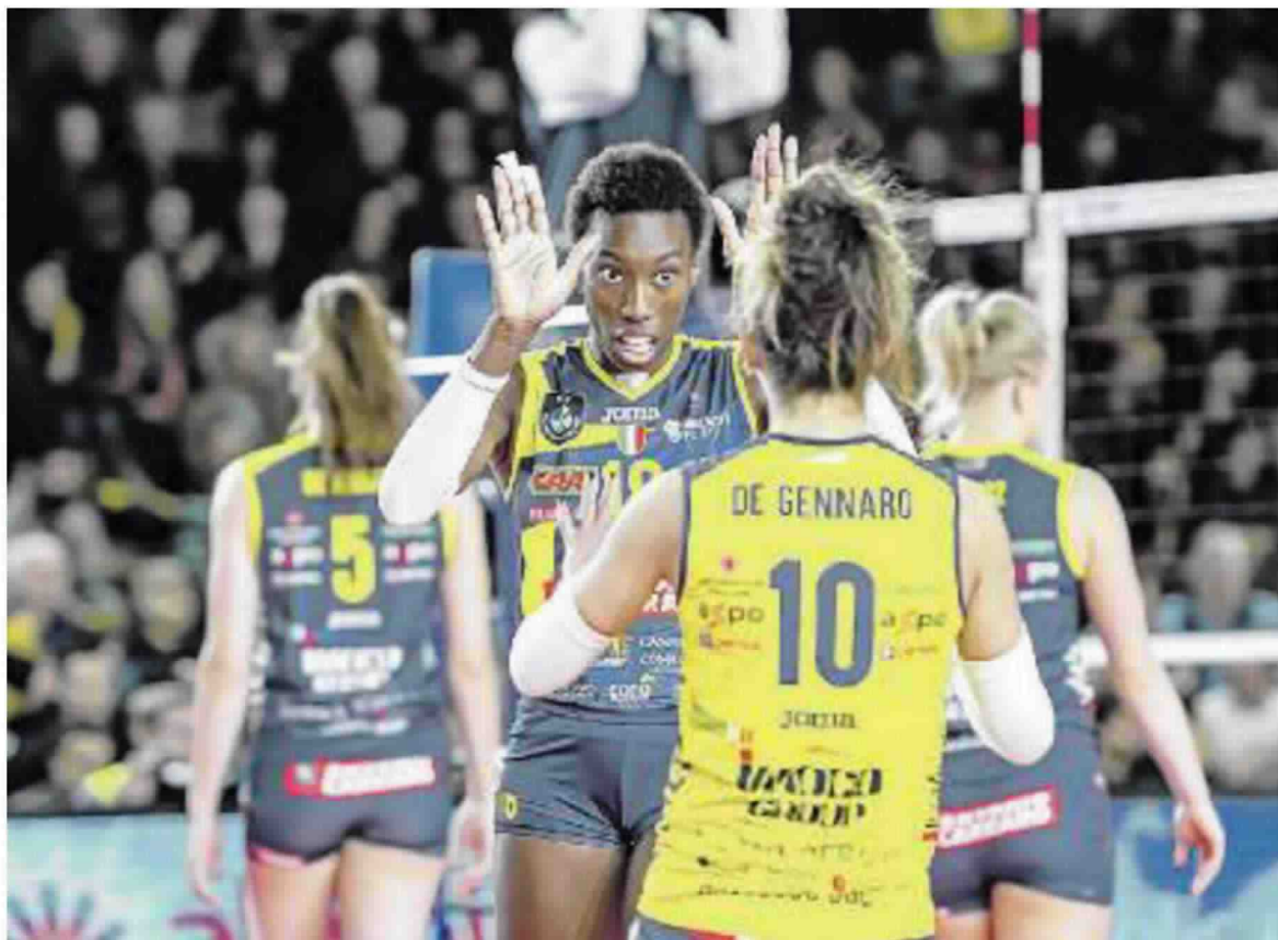
NUMERO UNO La fuoriclasse Paola Egonu, padovana di Cittadella, ieri ha compiuto 21 anni