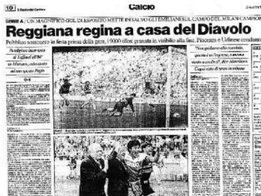
«CARLINO» La pagina del giornale uscito in edizione straordinaria

Note: spettatori paganti 11.872, abbonati 58.532. Nessun ammonito, nessun espulso.