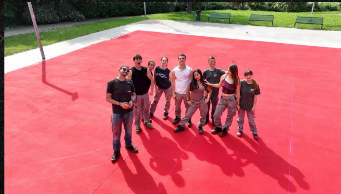
Work in progress "Playground Revolution"

La metafora del "rebound" si estende all'ambiente con due progetti distinti: