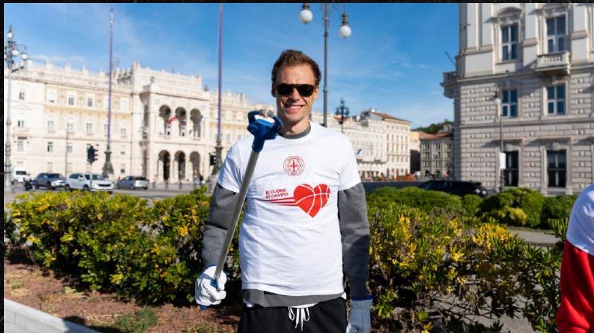
Pulizia Rive di Trieste